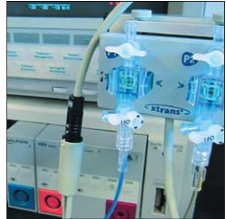
Рис. 8. Анестезиологическое оборудование

В этой системе на соединители ODU возложена большая ответственность: если такое устройство сломается, то помпа перестанет качать кровь и пациент не выживет.