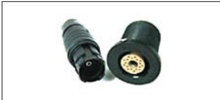
Рис. 3. Разъем со вставкой для жидкости

В данном типе разъемов можно рассмотреть разъемы со вставкой для передачи жидкости и 18 сигнальными контактами, диаметр которых составляет 0,5 мм. Вставка имеет наружный диаметр 3,1 мм, внутренний же диаметр равен 1 мм. Внешний диаметр самого разъема составляет 18,7 мм (рис. 3). Этот тип разъемов применяется в медицинском оборудовании.