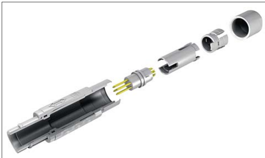
Рис. 2. Разъем MINI-SNAP PC в разобранном виде

На протяжении последних двух лет компания ODU разработала несколько специальных решений пластиковых разъемов серии MINI-SNAP PC со вставками для передачи жидкостей различных видов и типов.