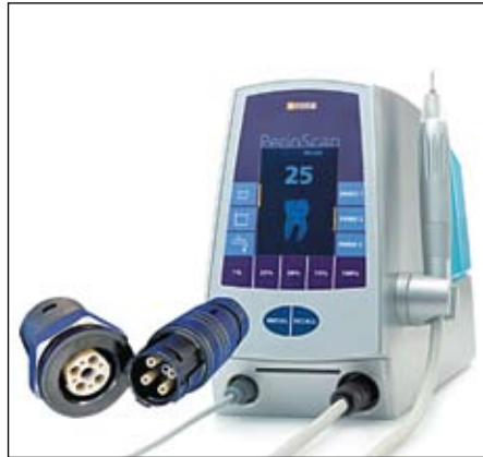
Рис. 6. Ультразвуковой прибор с разъемом MINI-SNAP PC

ультразвуковых приборов: для снятия зубного налета и камней (рис. 6).