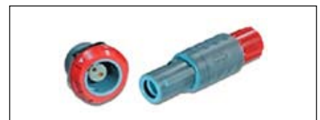
Рис. 9. Разъем серии MEDI-SNAP

Этот тип соединителей популярен у российских производителей, так как имеет хорошее соотношение цены и качества. Такие соединители востребованы производителями медицинского оборудования (рис. 9). Особенно большой интерес вызывают разъемы серии MEDI-SNAP со специальными вставками — жидкостной и оптической, а также трехконтактные разъемы для подачи сетевого питания.