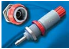
Рис. 10. Разъем MEDI-SNAP со вставкой для жидкости