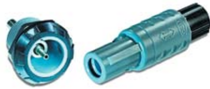
Рис. 11. Разъем MEDI-SNAP с оптической вставкой

Разъемы MEDI-SNAP с волоконно-оптической вставкой рассчитаны на более чем 1000 циклов соединения и разъединения, они имеют степень защиты IP50 в сомкнутом состоянии. Этот тип разъемов в кодировке также имеет 7 цветов и 6 вариантов ключей — от 0° до 205°. Оптическая вставка разъемов рассчитана под обжим (рис. 11) и применяется под кабель LWL-POF 980/1 мкм.