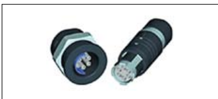
Рис. 5. Разъем MINI-SNAP PC для ультразвукового прибора

Данные следующего типа разъема: внешний диаметр — 18,7 мм, 1 вставка для передачи жидкости из нержавеющей стали, наружный диаметр — 2,5–3,5 мм, внутренний диаметр — 1 мм, 4 сигнальных контакта диаметром 0,7 мм каждый и 4 высоковольтных контакта диаметром 0,7 мм. Степень защиты такого типа разъема — IP50 в сомкнутом состоянии (рис. 5). Этот тип разъема был разработан специально для стоматологических