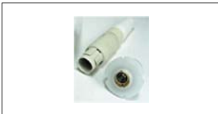
Рис. 4. Пластиковый разъем со вставкой для жидкости

Другой тип разъемов со вставкой для передачи жидкости имеет наружный диаметр 3–7 мм, внутренний диаметр 1,6–5 мм и 4 сигнальных контакта, диаметр которых составляет 0,9 мм. В таких разъемах предусмотрено отверстие для нейлоновой нити, что позволяет разгрузить провод от напряжения. Степень защиты — IP50 в сомкнутом состоянии. Внешний диаметр разъема составляет 15,7 мм. Этот тип разъемов применяется в медицинских приборах для проведения липосакции (рис. 4).