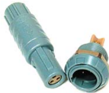
Рис. 12. Трехконтактный разъем серии MEDI-SNAP

Корпус разъема диаметром 14 мм выполнен из полисульфона. Контакты «гнездо» расположены на кабельной части (вилке), а контакты «штырек» — на его приборной части (розетке). Диаметр контактов составляет 0,9 мм, контакты покрыты золотом 0,75 мкм. Разъемы просты в сборке и применении, имеют малый вес и большой срок службы без повреждения контактов. Номинальная токовая нагрузка при двух нагруженных контактах составляет 10 А, а при трех — 9 А (рис. 12).