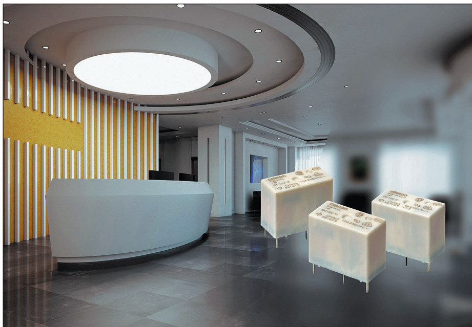
Рис. 1. Новые инновационные малогабаритные реле широкого применения Omron G5Q-EL [1]

Бытовая техника, электрические плиты, возобновляемая энергетика, инверторы, системы освещения, роботы и промышленная автоматика — все это область приложения силовых реле. И особая проблема, с которой она связана, — дугообразование. То есть возникновение электрической дуги в момент, когда ток продолжает течь через зазор между контактами реле при условии, что они еще не замкнулись или начинают размыкаться. И хотя такое событие обычно очень короткое, его влияние может значительно сократить срок службы контактной системы и реле выйдет из строя. Контакты просто могут привариться друг к другу и не разомкнуться. Эта дуга и превращается в ту ложку дегтя, которая ограничивает срок эксплуатации реле, как правило, до нескольких десятков тысяч коммутационных циклов, однако сам механический компонент способен выдерживать миллионы операций переключения. Причем дуга может быть следствием не учтенных, а случайных процессов. Ее негативное воздействие увеличивает дребезг контактов, возникающий при их замыкании, представляющий, если говорить образно, многократное замыкание цепи, связанное с механическим отрывом замыкающего контакта. В данный процесс включена и сама конструкция контактной системы, и масса контакта, и сила упругости, и методы демпфирования механического колебательного процесса. Проблема эта непростая, ведь