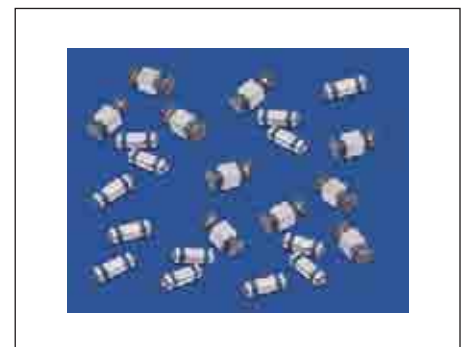
Рис. 4. Фильтры серий PSM и SSM

Фильтры серии SSM (Square Surface Mount) имеют только P i -электрическую схему, рассчитаны на рабочий ток 10 А и напряжение постоянного тока 100 В. Их электрическая емкость может быть 100, 500, 1500, 2000 и 4000 пФ.