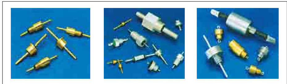
Рис. 2. Помехоподавляющие фильтры Spectrum Control

Фильтры всех типов выпускаются как для гражданского, так и для военного применения (в соответствии со стандартами MIL-F-15733 и MIL-F-28861). Основные параметры фильтров всех групп приведены в таблице 2.