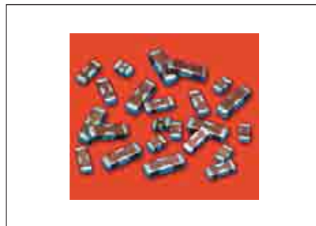
Рис. 3. Трехвыводные керамические фильтры

Spectrum Control разработала и выпускает керамические трехвыводные чипы — фильтры С-, L-С- и P i -типов (рис. 3).