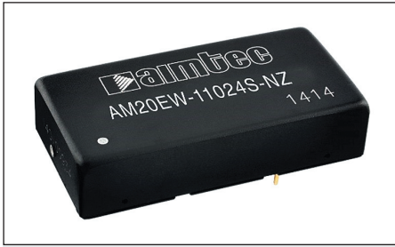
Рис. 1. DC/DC-преобразователь AM20EW

Полный перечень DC/DC-преобразователей представлен в таб-лице 1.